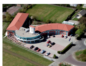
Fletcher Duinhotel Burgh Haamstede **** (Burgh Haamstede)

Lors de la sélection de l'hébergement, nous essayons de tenir compte autant que possible d'un abri à vélos sûr et fermé. Cependant, nous ne pouvons pas le faire avec toutes les garanties et cela dépend en partie du nombre de bicyclettes des autres hôtes.